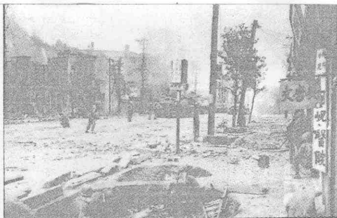
漢城曾經在戰火中成為廢墟。