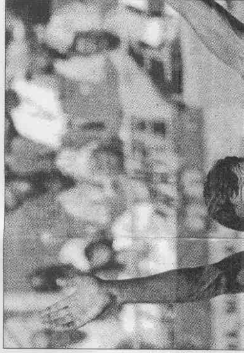
▲阿根廷克雷斯波今年表現穩定，進球後表情相當高興。