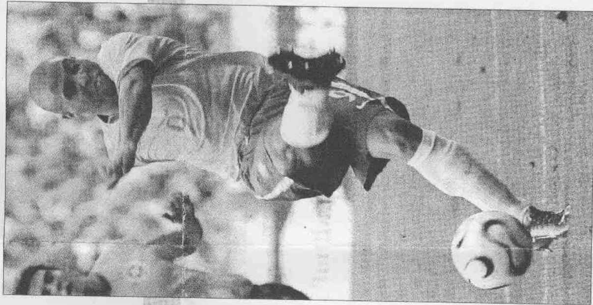
▲巴西羅納度動作遲緩，這一腳勁射竟然「揮灑落空」。