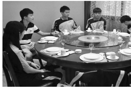
中國石油大學設宴歡迎本校桌球隊職員