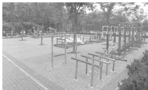
戶外健身運動器材